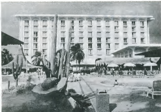
Aruba Palm Beach Hotel

Di parti di F.T.A. sin duda nos ta sumamente kontento ku SiK ta sali atrobe. I sin duda el a hasi falta durante di un aña. Nos lo trata siguramente di kontribui unda ku ta posibel.